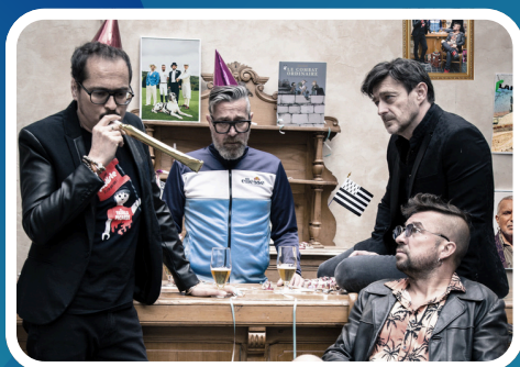
LES FATALS PICARDS tête d'affiche