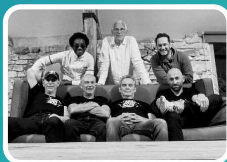
MAJOR & BRB